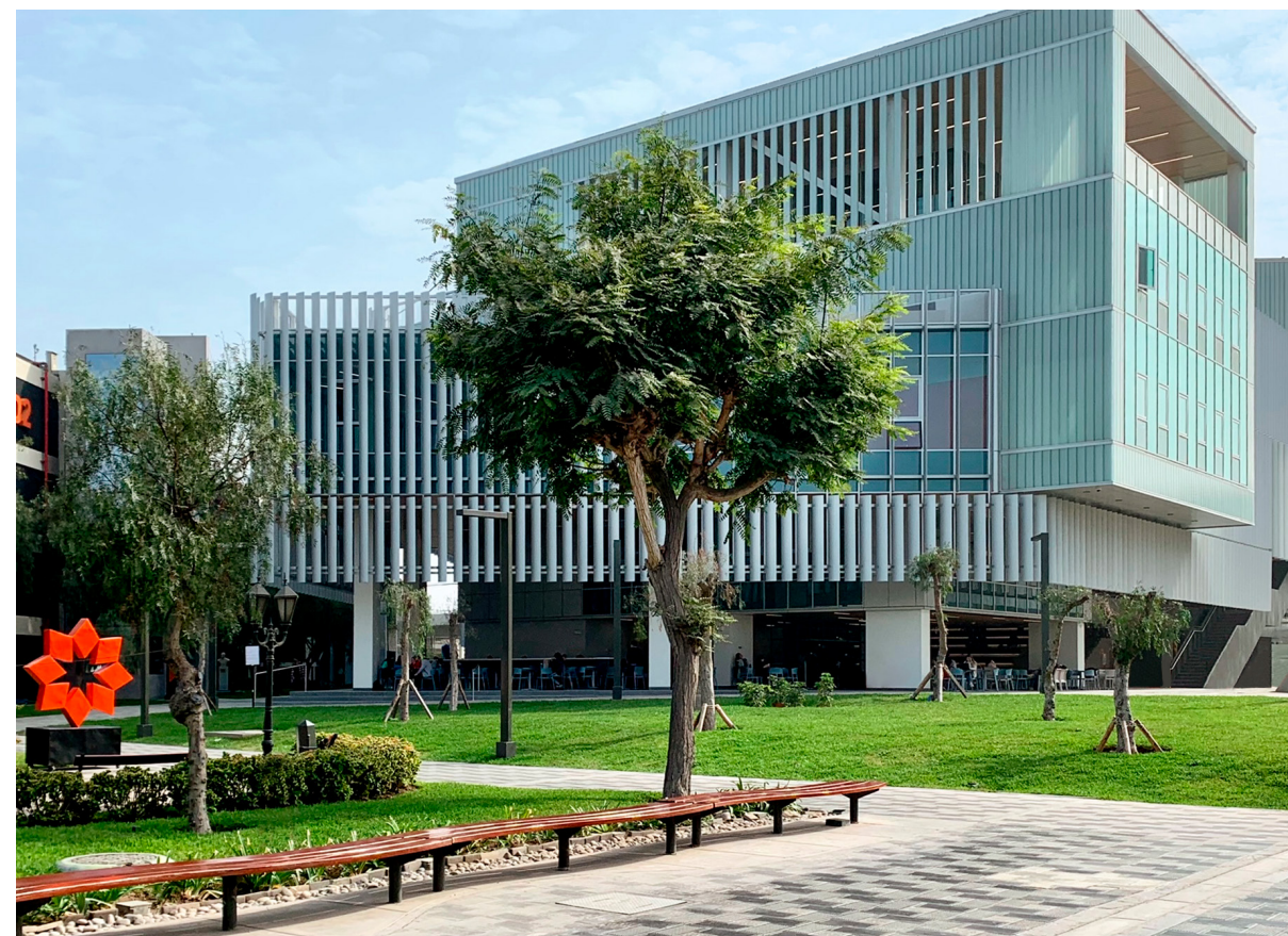
Centro de Bienestar Universitario