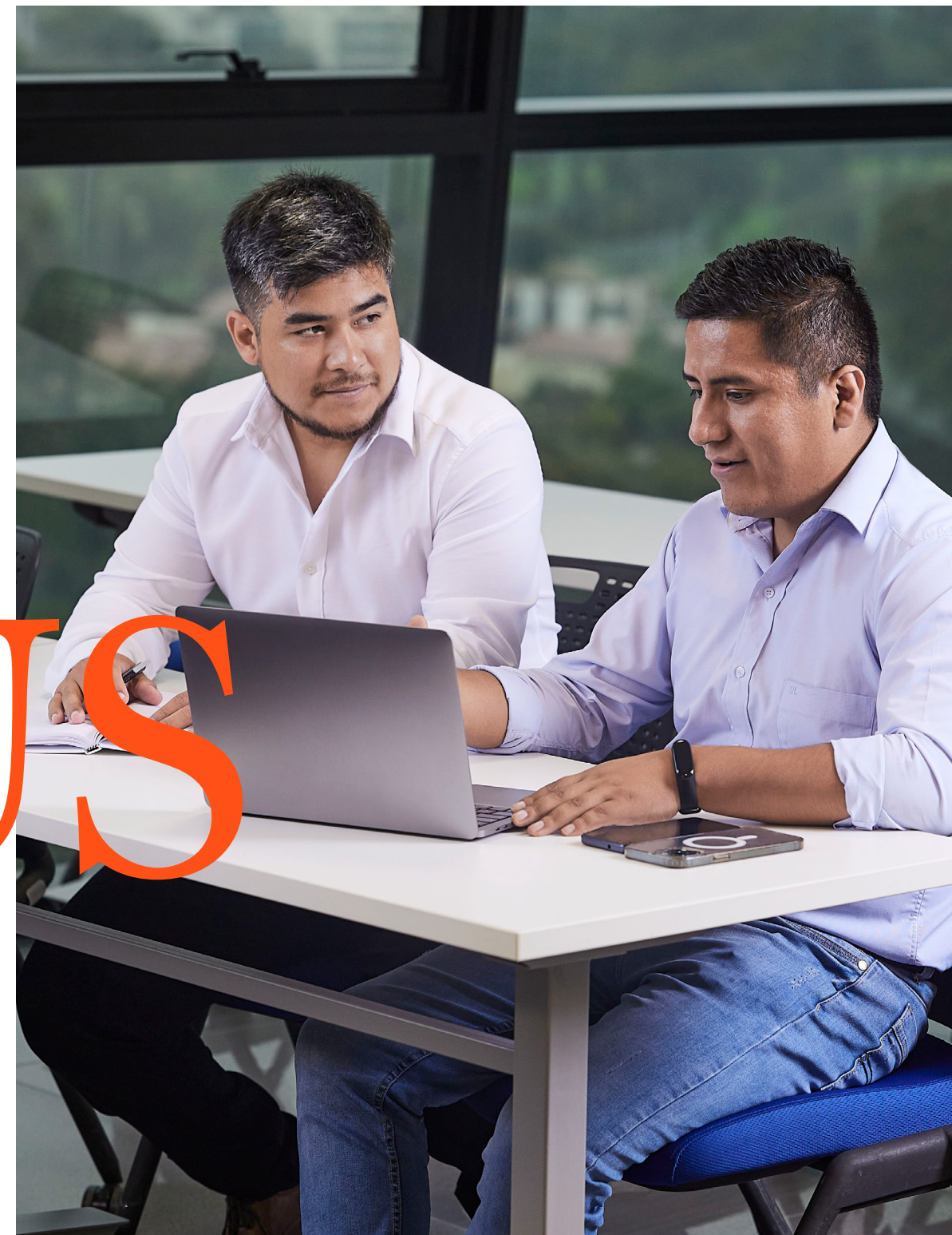
Salón de clase

Desde aulas equipadas con la última tecnología hasta espacios diseñados para fomentar tu desarrollo físico, mental y cultural, nuestro campus ofrece un ambiente inspirador que promueve el aprendizaje y el crecimiento personal.