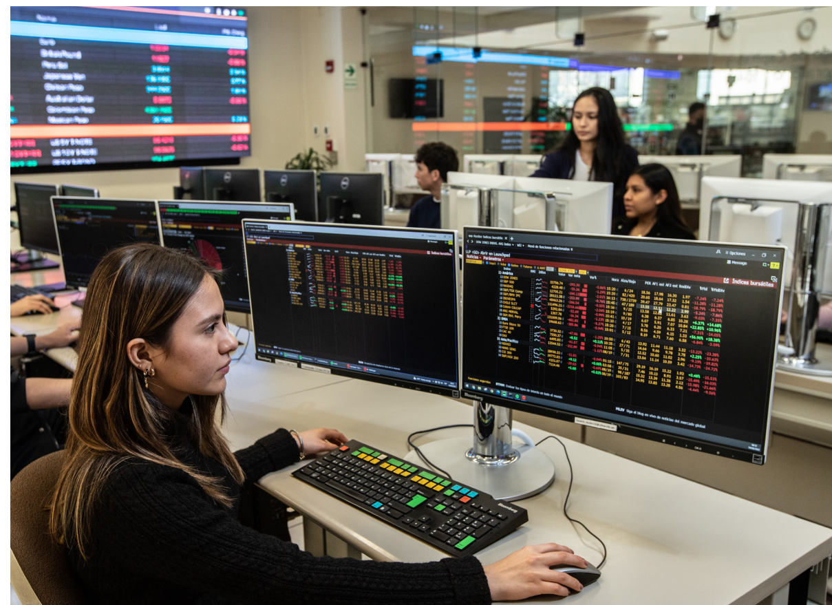
Laboratorio de Mercado de Capitales